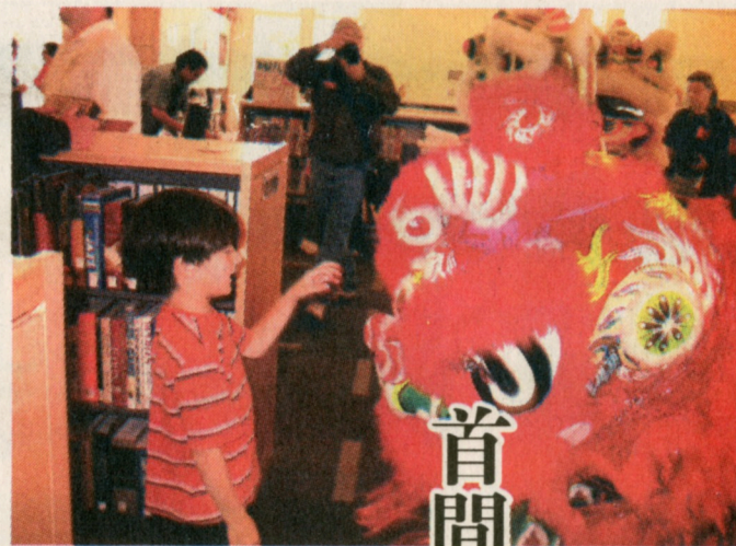
舞獅表演令本應寧靜的圖書館熱鬧非常，小朋友更對獅頭大感興趣。