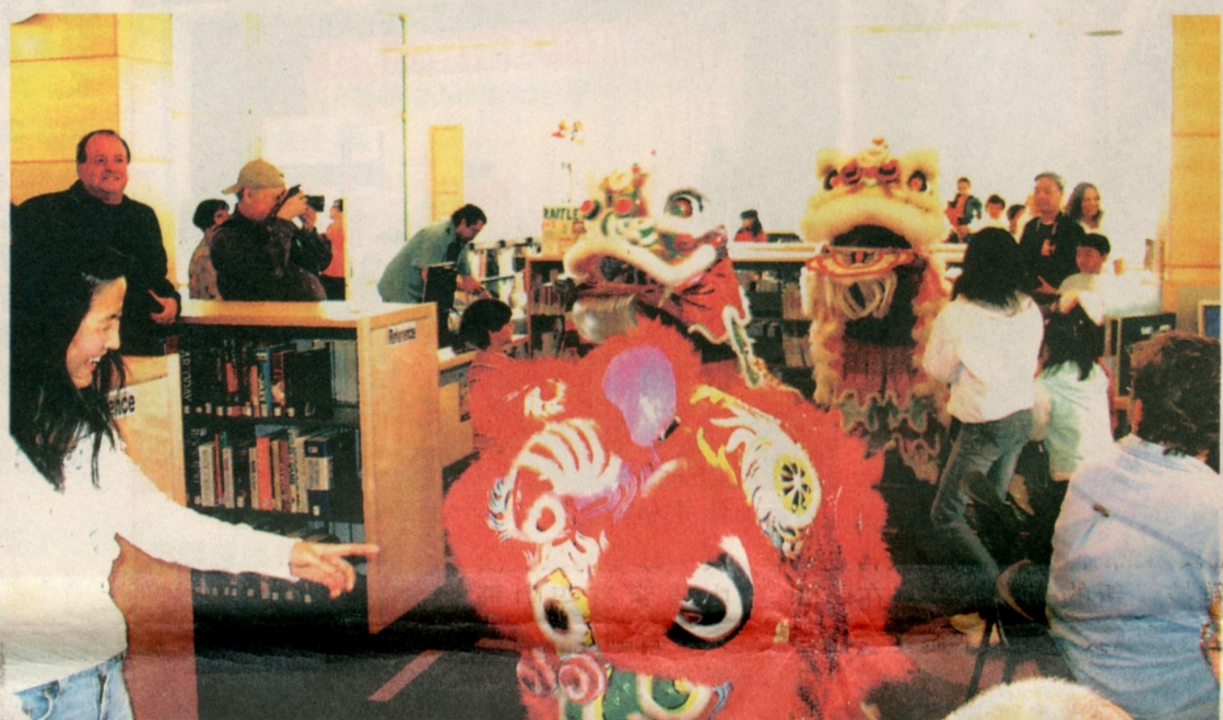
上圖：重新開放的圖書館吸引大批市民到場借閱圖書。下圖：醒獅隊走入圖書館內舞弄一番，氣紛十分熱烈。