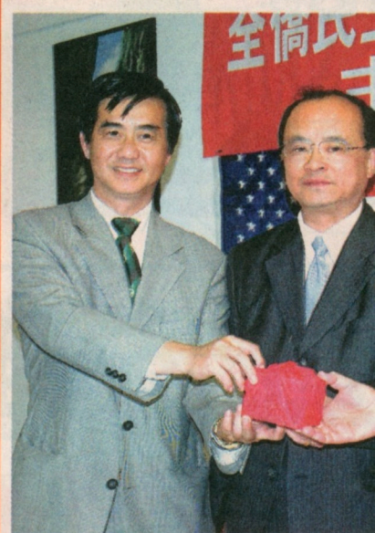
■全僑民主和平聯盟美國北加州分會交接儀式。